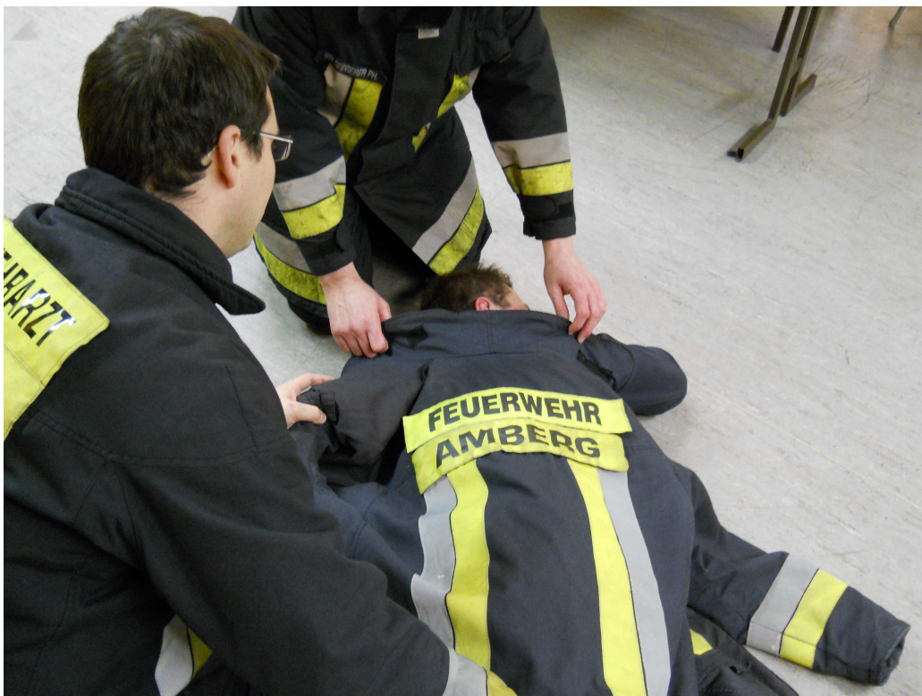
Betroffenen mit seiner Überjacke zudecken

Ausarbeitung: Marc Bigalke (Feuerwehrarzt), SBI Philipp Seegerer, FBL Karl Diepold