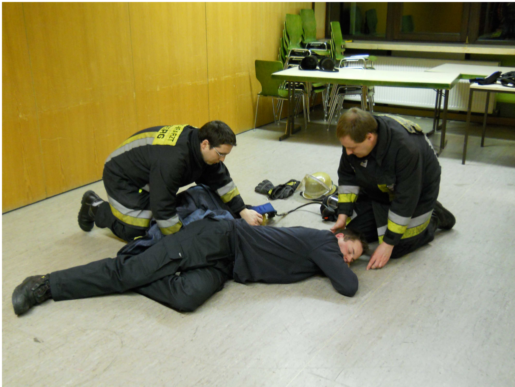
Dem abgewandten Arm nach hinten herausziehen, Jacke und PA entfernen