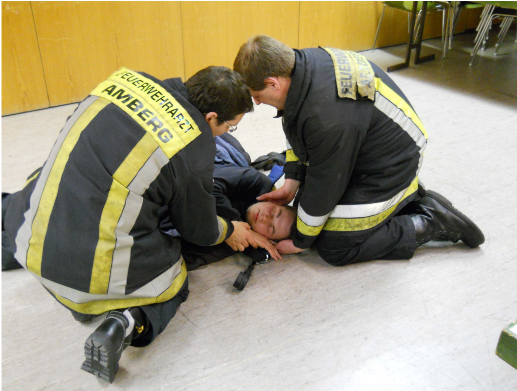
Arm vor der Brust kreuzen, Handoberfläche an die Wange des Betroffenen legen