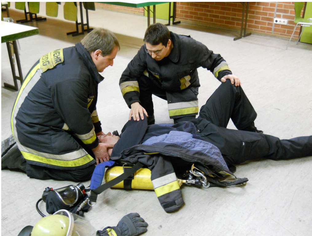
Das dem AS-TM zugewandte Bein aufstellen