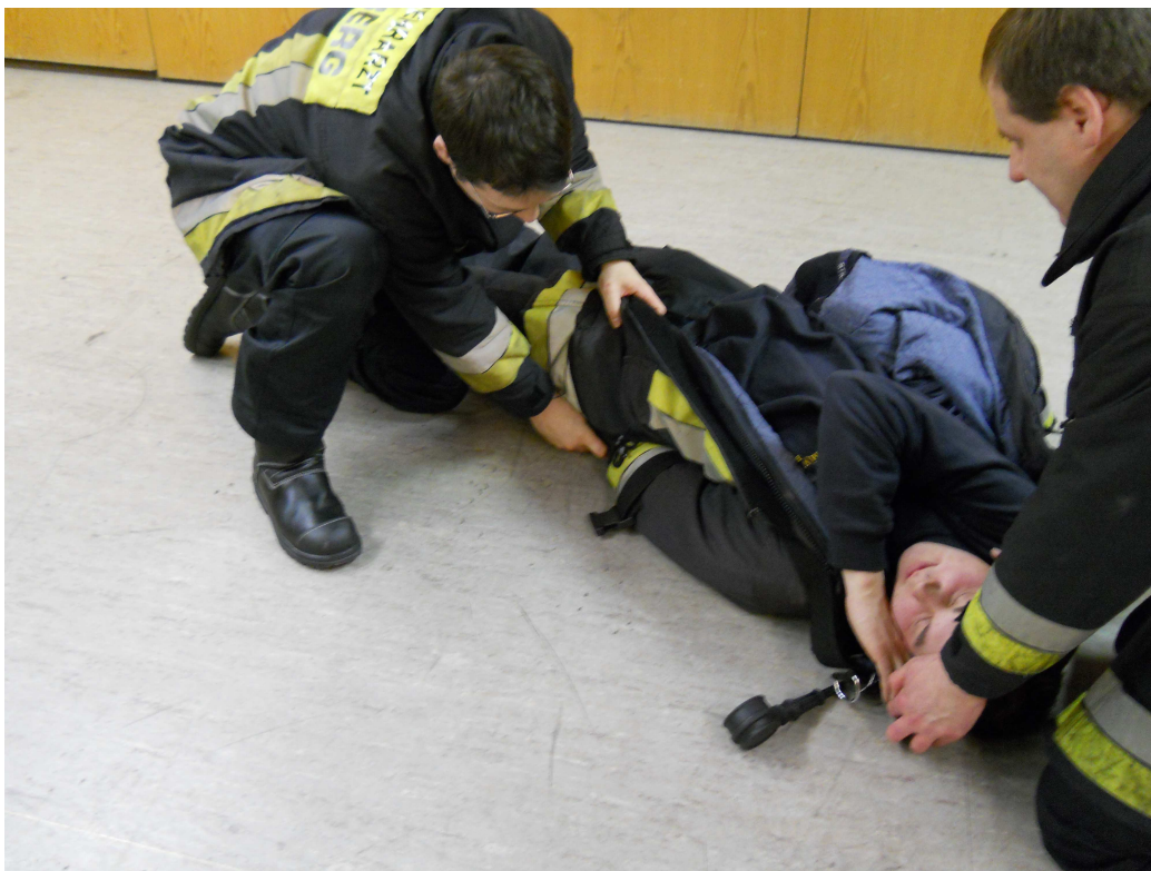
Unteren Arm mit dem Tragegurt gestreckt unter das Gesäß bringen