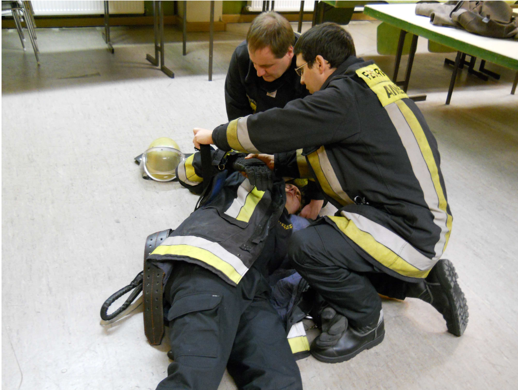
Begurtung (Tragegurt und Leibgurt) des Atemschutzgerätes öffnen, oberen Arm aus Tragegurt und Jacke bringen