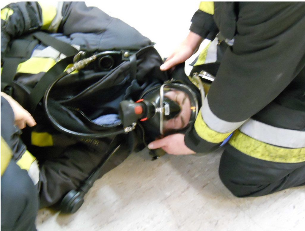
AS-TF fixiert den Kopf, bis der Verletzte in stabiler Seitenlage liegt