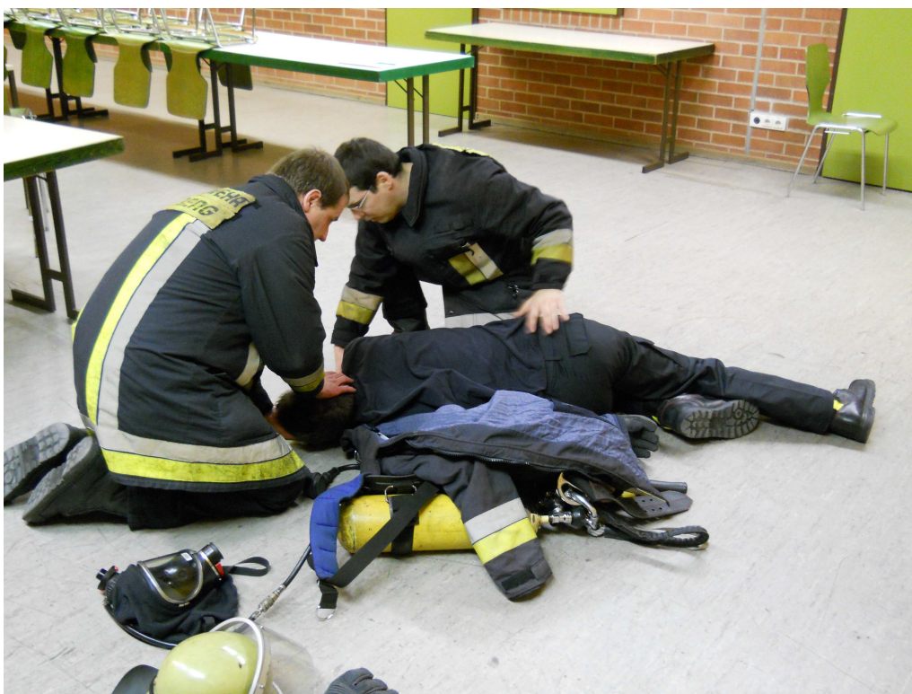
Betroffenen unter Schonung der Wirbelsäule zu sich herüberziehen