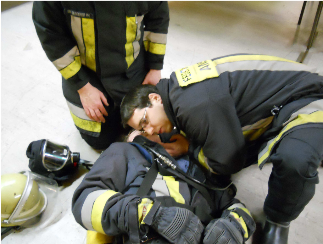
AS-TM kontrolliert Fitalfunktionen